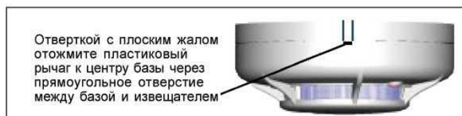
Рис. 4. Извлечение извещателя из базы

установкой базы произведите операции в соответствии с указаниями на рис. 3. Для снятия извещателя серии ЕСО1000 после активизации функции защиты используйте отвертку с плоским узким жалом как показано на рис. 4.