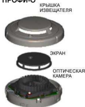
Рис 3. Дымовой извещатель ИП 212-73 ПРОФИ-О